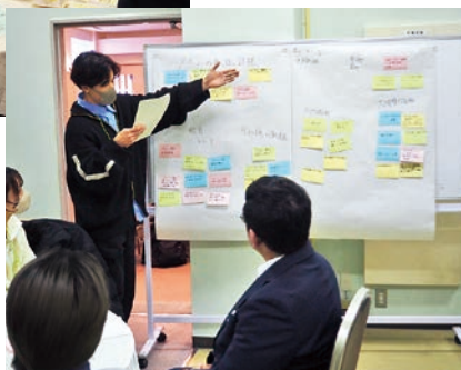
右：発表の様子 (ともに福島会場)