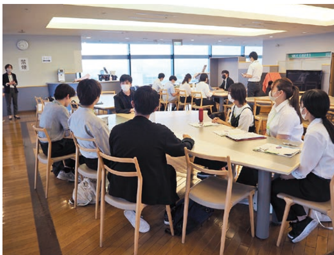
OB社員との座談会の様子