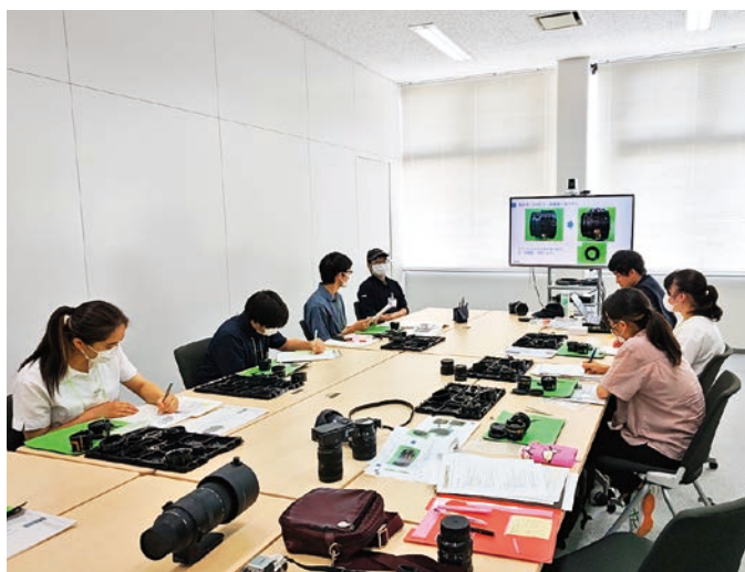
レクチャーを受けながらカメラレンズの分解体験