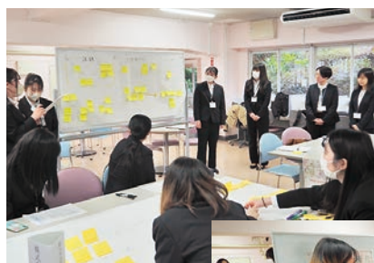
左：発表の様子 下：グループワークの様子 (ともに郡山会場)