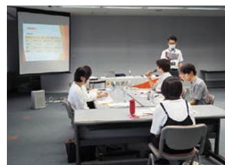
資産運用ゲームで投資や将来のマネープランを学ぶ様子